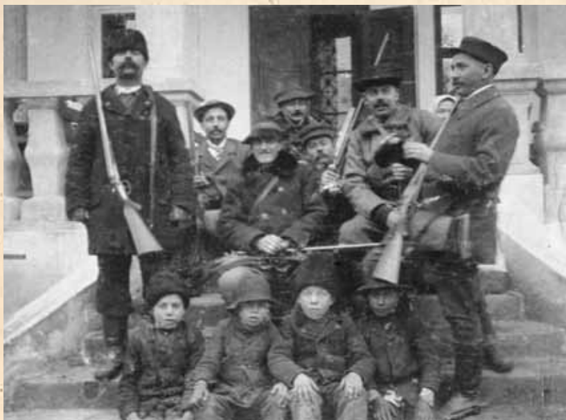
Jedna od prvih fotografija vinkovačkih lovaca