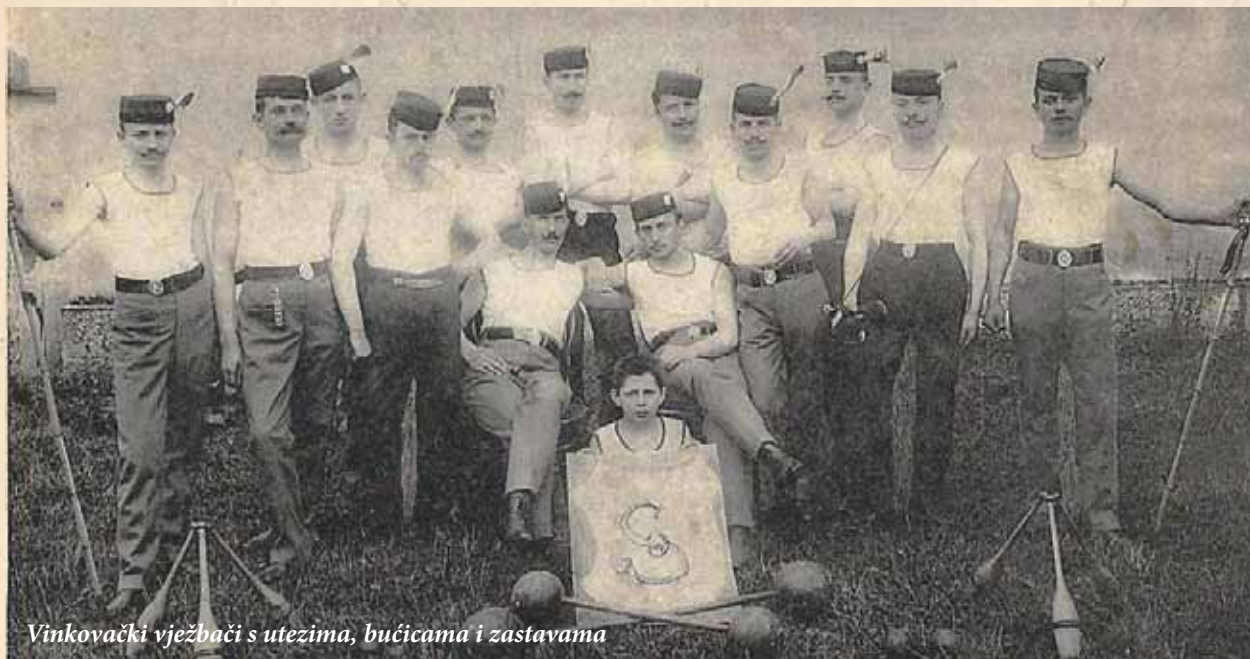
Vinkovački vježbači s utezima, bućicama i zastavama